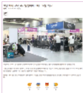
TV, 인터넷 뉴스 보도 / DB 약 20만개 보유