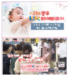
광주, 전남 약 350만명 시청 / 30일간 SA타임 송출