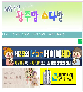
광주지역 최대맘카페 / 회원수 약 8만명