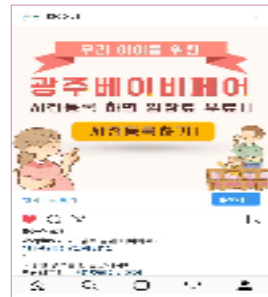
개최소식, 이벤트 공지