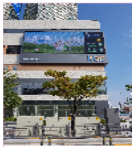
광주최대 유동인구 유스퀘어 맞은편 / 1일 약 120회 송출