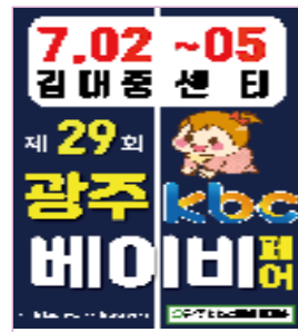
광주 전지역 200조 계첩