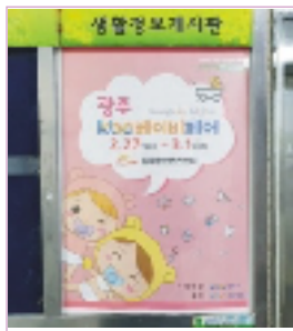
아파트 게시판 부착 / 병원, 돌잔치, 스튜디오 등 배포